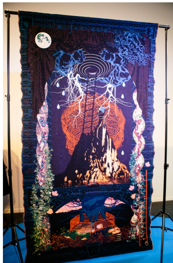
De drie tapijten staan opgesteld in het Antwerp Art Paviljoen voor het MAS.

penschild staat, maar ik heb net zo goed de stijging van de zeespiegel en de voorspellingen daarover verwerkt. Ik vraag me af hoe ze dat over 450 jaar zullen interpreteren."